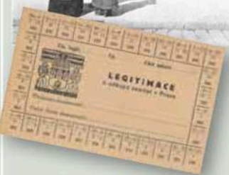
Každodenní realita válečných let: fronta před obchodem s potravinami a legitimace na nákup brambor

vrchovatou měrou naplnil původní záměr pražské obce, která vybudovala Obecní dům nejenom jako své reprezentační sídlo a prostor vyhrazený k podpoře rozvoje kulturního a společenského života Pražanů, ale také jako místo určené k prezentaci české společnosti coby kulturně i politicky vyspělého národa.