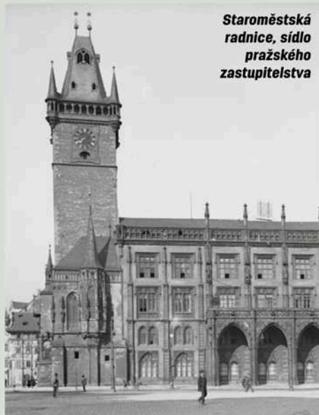
Staroměstská radnice, sídlo pražského zastupitelstva

František Soukup, Jiří Stříbrný a Vavro Šrobár, později označovaní jako „muži 28. října“, podepsali v pondělí 28. října 1918 v podvečer zákon o vzniku samostatného československého státu a přijali souhlas velení 8. armádního sboru rakouské armády s kapitulací. Tím se