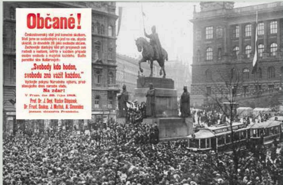
Václavské náměstí 28. října 1918 a vyhláška pražského zastupitelstva s oznámením o vzniku samostatného státu