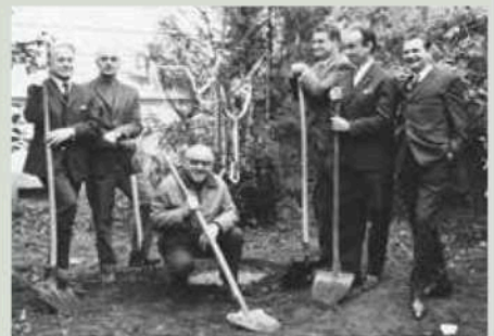
Učitelé ZŠ Pernerova 28. 10. 1968 u právě zasazené lípy svobody

S ohledem na místo konání věnovali autoři výstavy hlavní pozornost tzv. „mužům 28. října“ a událostem bezprostředně souvisejícím s vyhlášením samostatného československého státu včetně jejich dopadu na pražskou samosprávu. Vystavené dokumenty úřední i soukromé povahy, jako např. legitimace členů předsednictva Národního výboru, poznámky