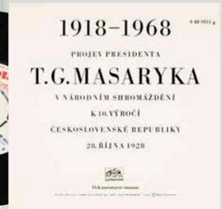
Gramofonová deska se záznamem slavnostního projevu prezidenta T. G. Masaryka z 28. 10. 1928

Antonína Švehly k Národní přísaze či deník Aloise Rašína z vězení, návštěvníkům přiblíží nejenom politickou činnost „mužů 28. října“, ale částečně jim dovolí poznat i jejich zázemí. Expozice je doplněna informacemi a exponáty k domácímu a zahraničnímu odboji během první světové války a nechybí ani archiválie dokumentující přistoupení Slovenska ke společnému státu.