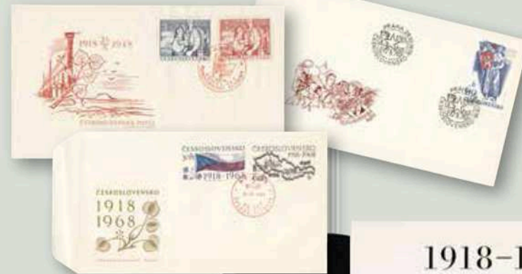
Obálky prvního dne k příležitosti výročí založení Československa